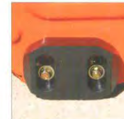
Kunststoff Gleitschuhe: Schonen empfindlichen Untergrund beim Arbeiten