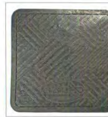
Gummimatte: Hält den Garagenboden sauber