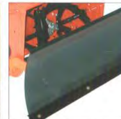
Kunststoff Schneeschild: Räumbreite 100 cm, passend für alle Ariens Fräsen